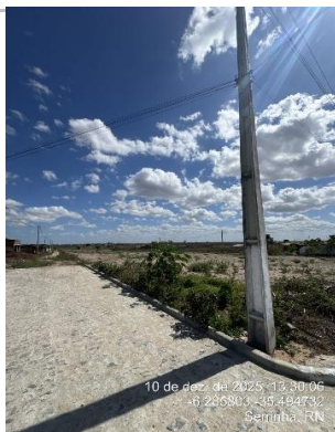
Foto 02 - INICIO RUA SILVIO SOARES LEMOS -6.285803, -35.494732