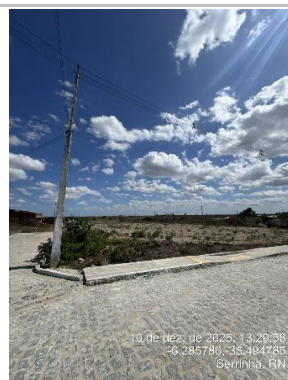
Foto 02 - INICIO RUA SILVIO SOARES LEMOS -6.285786, -35.494785