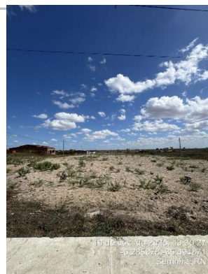
Foto 03 - CENTRO TERRENO -6.285878, -35.494871