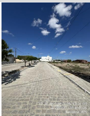
Foto 03 - AVENIDA MARIA JOSE CARDOSO DE -6.286027, -35.495108