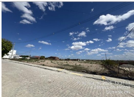
Foto 01 - Área da Frente -6.285953, -35.495098